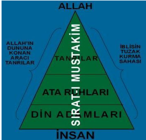
ŞİRKİN GENEL YAPISI

Şirkin yapısı aşağıdaki gibi gösterilebilir: