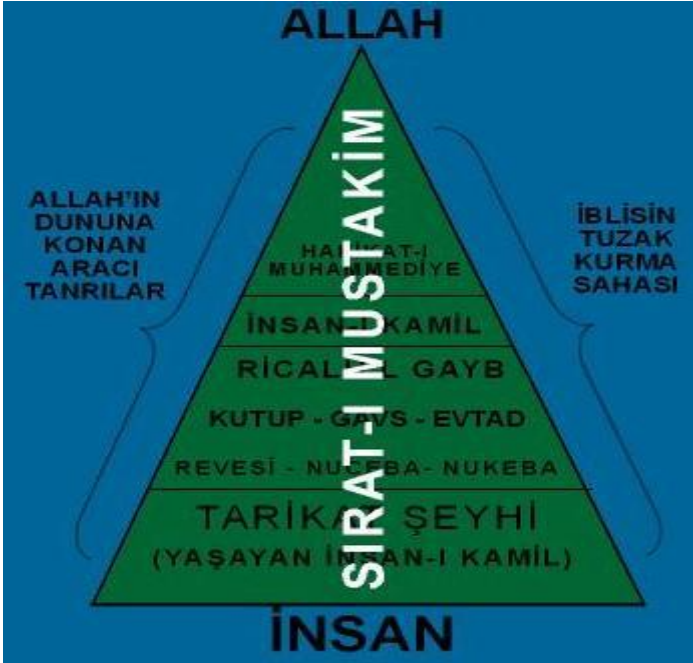
TARİKATLARDA GÖRDÜĞÜMÜZ ARACILAR

Hıristiyanlıkta aracılık inancı olduğu genişçe anlatılmıştı. Ona benzer bir inancın bir kısım tarikatlarda da olduğunu göstermeye çalışacağız. Aslında incelediğimiz tarikatların tamamında aracılık inancının var olduğunu gördük. Tarikatların hepsini incelemediğimiz için ihtiyatlı bir dil kullanmayı uygun bulduk. Tarikatlardaki araçlar, Hıristiyanlarda ve Taoistlerde olana benzer bir yapı oluşturmaktadır. Bu yapı, yaklaşık olarak şöyledir: